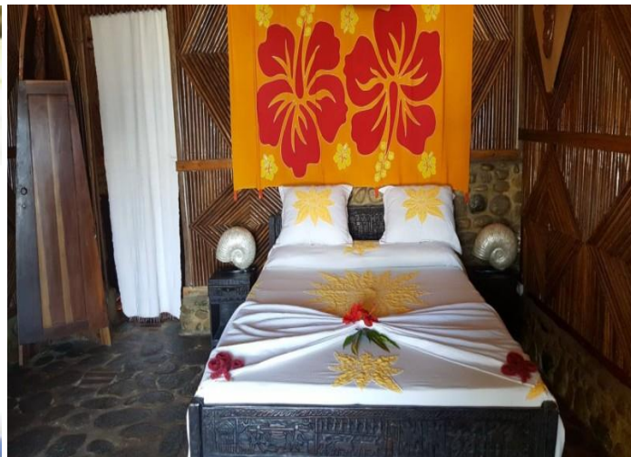
Zahir de l'Ile